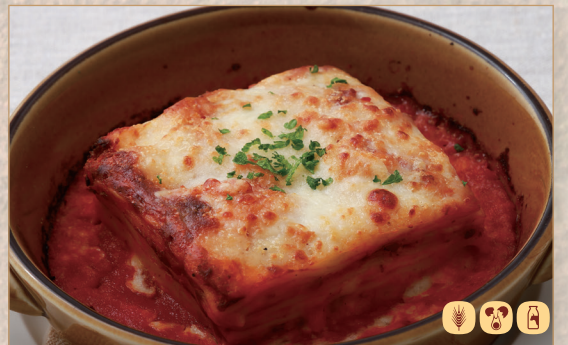
濃厚ミートソースのラザニア