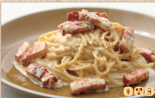
名古屋コーチン卵とベーコンの カルボナーラ

Carbonara with Nagoya Cochin Egg & Bacon 名古屋科钦鸡蛋与培根卡邦尼意面