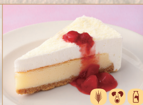
レアチーズケーキ(苺ソース) No-bake cheese cake 生乳酪蛋糕(草莓酱)