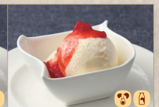
バニラアイス(苺ソース) Vanilla Ice Cream 香草冰淇淋