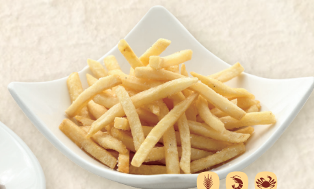
フライドポテト (トリュフ風味) Truffle Salt French Fries 松露盐味薯条 ¥636 [¥700]