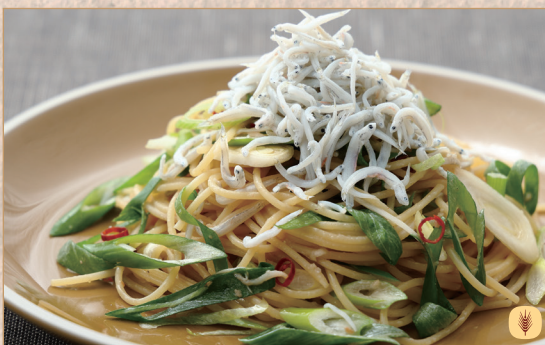
しらすと九条ネギ ペペロンチーノ

Peperoncino with Whitebait & Kujo Green Onion 银鱼与九条葱蒜辣椒橄榄油意面