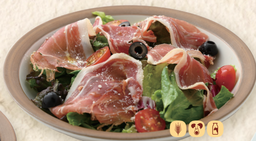
生ハムサラダ Prosciutto Salad 生火腿沙拉 ¥891 [¥980]