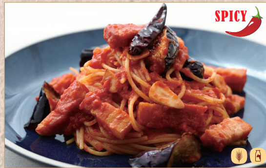
茄子とベーコンのアラビアータ

Arrabbiata with Eggplant & Bacon 茄子与培根阿拉比亚塔辣味意面