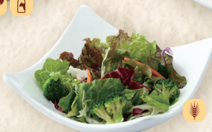
ミニサラダ Mini Salad / 迷你沙拉 ¥364 [¥400]