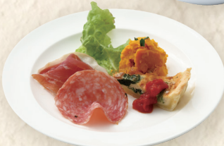
本日の前菜 Today's Appetizer 今日前菜 ¥545 [¥600] 前菜は日替わりです。

税抜価格 [税込価格] Excl. tax [Incl. tax] 未含税价格 [含税价格]