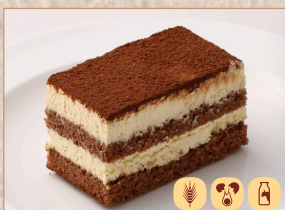
ティラミス Tiramisu 提拉米苏