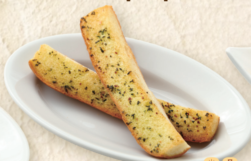
ガーリックトースト Garlic Toast 蒜香吐司 ¥409 [¥450]