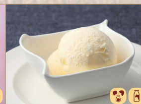
バニラアイス Vanilla Ice Cream 香草冰淇淋