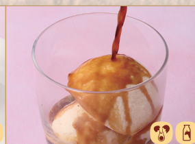
アフォガート Affogato 阿芙佳朵