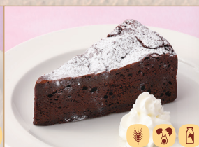
ガトーショコラ Chocolate Cake 巧克力蛋糕