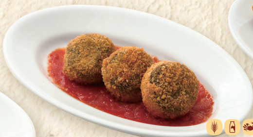
イカ墨のライスコロッケ Squid Ink Rice Croquettes 墨鱼汁米饭可乐饼 ¥545 [¥600]