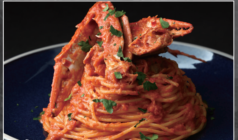
渡り蟹のトマトクリームパスタ ¥1,818 [¥2,000]