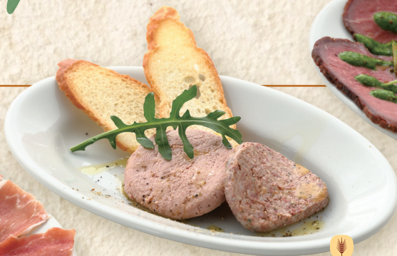
レバーペースト二種 Two Kinds of Liver Pâté 两种肝酱 ¥591 [¥650]