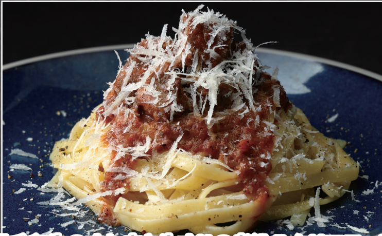
黒毛和牛のすね肉と牛すじの煮込みタリアテッレ ¥2,273 [¥2,500]