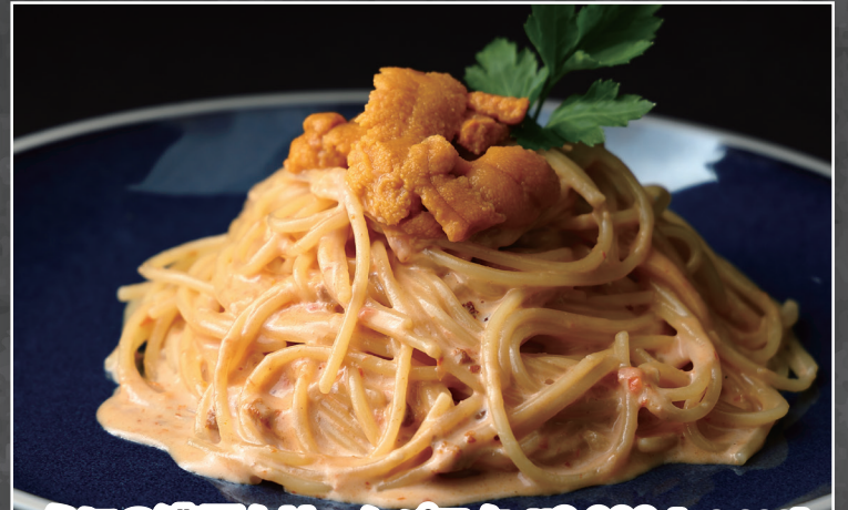
うにの濃厚クリームパスタ ¥2,000 [¥2,200]