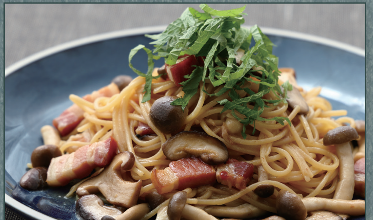
きのこ厚切りベーコンの香ばし醤油 ¥1,182 [¥1,300]

Mushrooms & Thick-cut Bacon in Fragrant Soy Sauce 蘑菇与厚切培根 香醇酱油风味意面