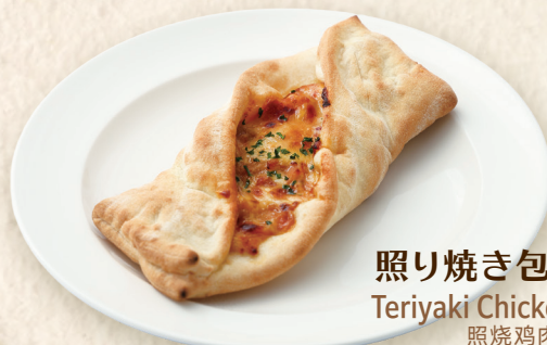
照り焼き包みピッツァ Teriyaki Chicken Wrap Pizza 照烧鸡肉卷披萨 ¥527 [¥580]