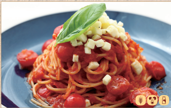
モッツァレラと完熟トマトソースの ポモドーロ

税抜価格 [税込価格] Excl. tax [Incl. tax] 未含税价格 [含税价格]