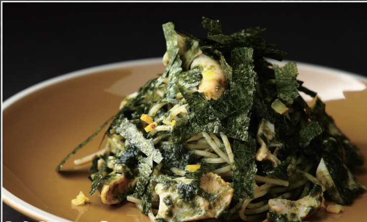
国産海苔とつづ貝のペペロンチーノ ¥1,727 [¥1,900]

Peperoncino with Japanese Nori & Whelk 国产海苔与海螺蒜辣椒橄榄油意面