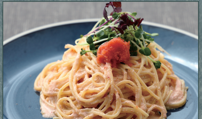
明太子の和風クリームソース ¥1,255 [¥1,380]

Japanese-style Cream Pasta with Mentaiko 明太子和风奶油意面