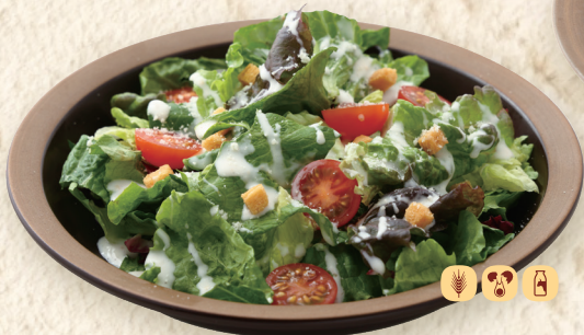
クラシック・シーザーサラダ Classic Caesar Salad 经典凯撒沙拉 ¥682 [¥750]