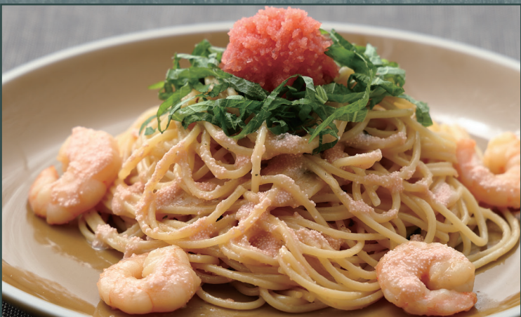
たらこ小海老、大葉のバター醤油 ¥1,436 [¥1,580]

Tarako, Small Shrimp & Shiso with Butter Soy Sauce 鳕鱼子、小虾与紫苏 黄油酱油意面