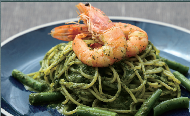
海老と大葉の和風ジェノベーゼ ¥1,545 [¥1,700]

Japanese-style Genovese with Shrimp & Shiso 海老与紫苏和风罗勒青酱意面