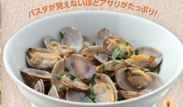
あさりの出汁香る ボンゴレビアンコ

Vongole Bianco with Clam Broth Aroma 蛤蜊清汤香气白酒蛤蜊意面