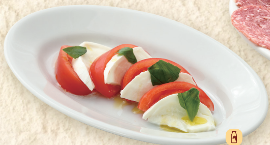
イタリア産モッツァレラのカプレーゼ Caprese with Italian Mozzarella 意大利马苏里拉卡普雷塞沙拉 ¥618 [¥680]