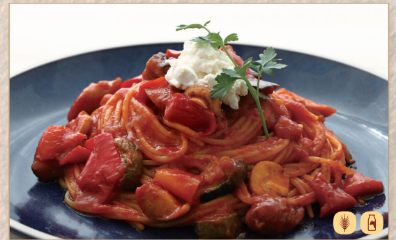
ドンサバティーニのナポリタン

Don Sabatini's Neapolitan Spaghetti 东·萨巴蒂尼式那不勒斯意面