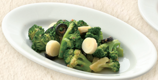
ブロッコリーのアンチョビマリネ Broccoli Marinated with Anchovy 鳀鱼腌西兰花 ¥527 [¥580]