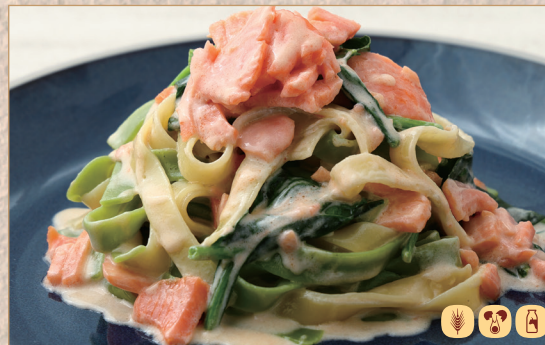
スモークサーモンとほうれん草の クリームソース 2色のタリアテッレ

Cream Pasta with Smoked Salmon & Spinach 烟熏三文鱼与菠菜奶油意面