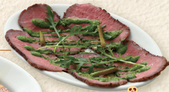
ローストビーフ (サルサベルデ) Roast Beef (Salsa Verde) 烤牛肉(青酱) ¥891 [¥980]