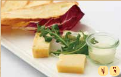
イタリアチーズの盛合せ Assorted Italian Cheeses 意大利奶酪拼盘 1600 円