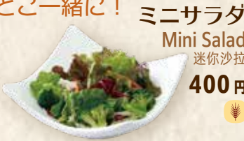
パスタと一緒に！ ミニサラダ Mini Salad 迷你沙拉 400 円