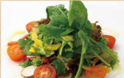
ミックスサラダ Mixed Salad 混合沙拉 800 円