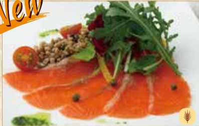
スモークサーモンのサラダ仕立て Smoked Salmon Salad 烟熏三文鱼沙拉 1600 円