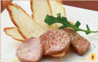
レバーペースト盛合せ Assorted Liver Pâté 肝酱拼盘 1200 円