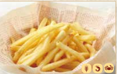
フライドポテト トリュフ塩味 Truffle Salt French Fries 松露盐味薯条 700 円