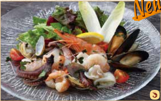
シーフードサラダ Seafood Salad 海鲜沙拉 1600 円