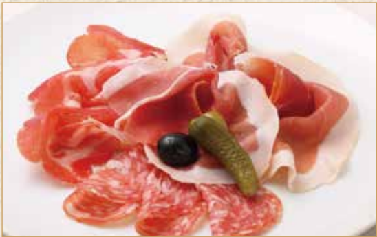
生ハムとサラミの盛合せ Assorted Prosciutto and Salami 生火腿和萨拉米拼盘 1400 円