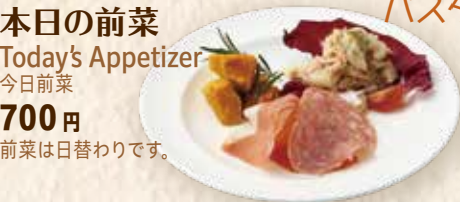
本日の前菜 Today's Appetizer 今日前菜 700 円 前菜は日替わりです。