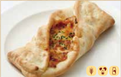
照り焼き包みピッツァ Teriyaki Chicken Wrap Pizza 照烧鸡肉卷披萨 580 円