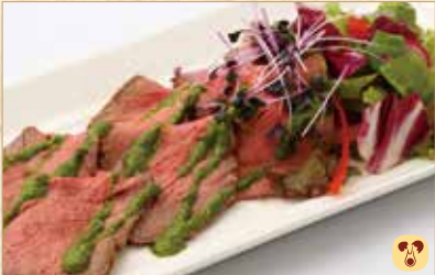
ローストビーフのサラダ Roast Beef Salad 烤牛肉沙拉 1600 円