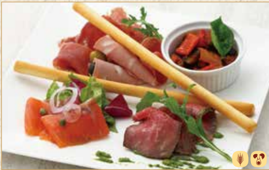
おすすめ前菜の盛合せ Assorted Appetizers 前菜拼盘 1800 円