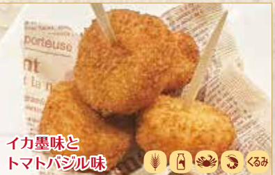
イカ墨味と トマトバジル味