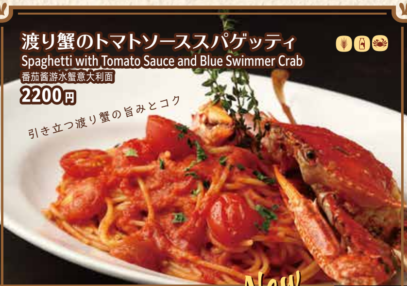
渡り蟹のトマトソーススパゲッティ Spaghetti with Tomato Sauce and Blue Swimmer Crab 番茄酱游水蟹意大利面 2200 円 引き立つ渡り蟹の旨みとコク