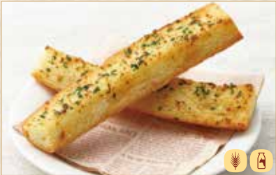
ガーリックトースト Garlic Toast 蒜香吐司 450 円