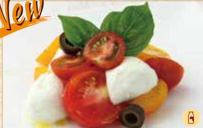
カプレーゼ Caprese 卡普雷塞沙拉 1600 円