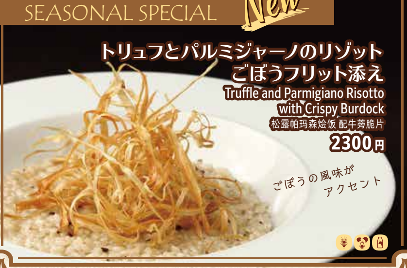
トリュフとパルミジャーノのリゾット ごぼうフリット添え Truffle and Parmigiano Risotto with Crispy Burdock 松露帕玛森烩饭 配牛蒡脆片 2300 円 ごぼうの風味が アクセント

ミートソースパスタ ハンバーグ エビフライ フライドポテト ゼリー 選べるおもちゃ ドリンク付き 980 円 12歳未満のお子様限定