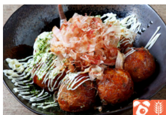
Takoyaki (octopus dumplings) たこ焼き 1,000yen