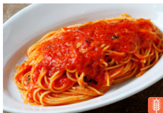
Spaghetti Arrabbiata スパゲッティアラビアータ 1,500yen