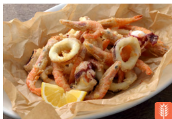
Mixed Deep-Fried Seafood (Shrimps and Squid) 魚介のセモリナ粉フリット 1,800yen