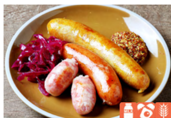
Assorted sausages ソーセージ盛り合わせ 1,600yen