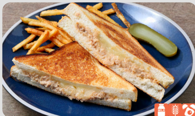
TUNA MELT SANDWICH ツナメルトサンド