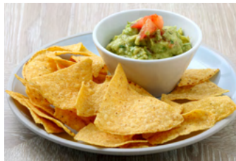
Guacamole ワッカモーレ 1,200yen