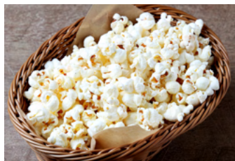
Popcorn ポップコーン 800yen