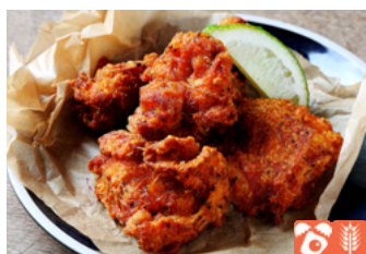
Spiced Chicken Fritters スパイスチキンフリット 1,000yen