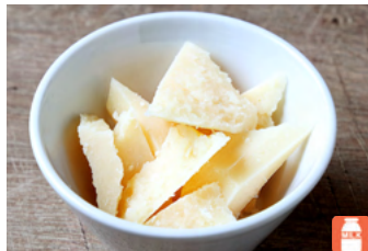
Parmesan cheese パルメザンチーズ 800yen