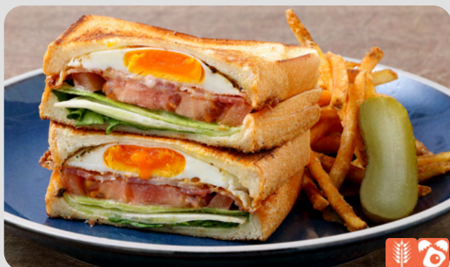
BLT SANDWICH BLTサンド