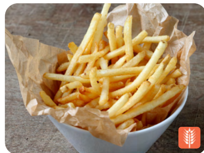
FRENCH FRIES フレンチフライ 500yen