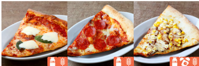
SLICE PIZZA Margherita / Pepperoni / Chicken Teriyaki マルゲリータ / ペパロニ / 照り焼きチキン 1,000yen