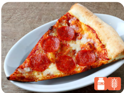
SLICE PIZZA Pepperoni スライスピザ ペパロニ 800yen