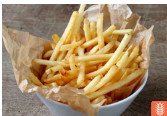
French Fries フライドポテト 800yen