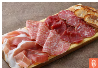
Prosciutto and Salami Platter 生ハムとサラミ盛り合わせ 2,800yen / Half 1,600yen