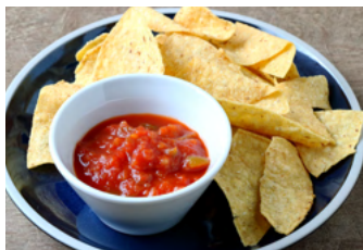
Nachos with Salsa Sauce ナチョス サルサソース 900yen