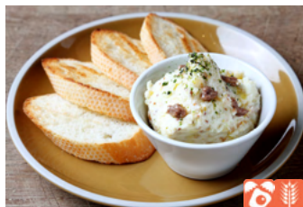
Potato Salad with Sea Bream and Anchovies with melba toast 鯛のアンチョビポテトサラダ メルバトースト 900yen