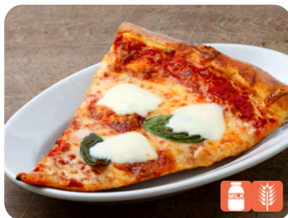
SLICE Margherita スライスピザ マルゲリータ 800yen