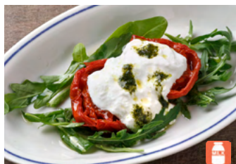
Grilled Tomatoes and "Stracciatella" Mozzarella Cheese Salad ストラチャテッラと焼きトマトの カプレーゼ 1,600yen

1F Il Cardinale Ginza Corridor Store's popular menu